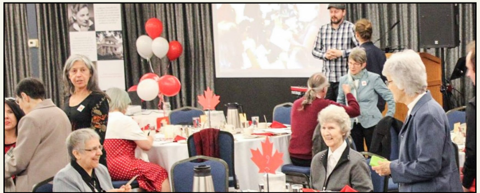
Après le brunch Gabrielle-Roy de 2017, dont le thème était « le Canada de Gabrielle Roy » (photo), celui de 2018 sera consacré à Gabrielle Roy dans le monde.

Une vingtaine d'auteurs et de poètes célébreront avec le public la Journée mondiale du livre et du droit d'auteur, autour d'un mini-salon du livre.